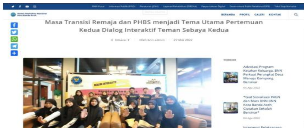
Gambar 2. Pemberitaan melalui web resmi BNN Kota Banda Aceh

“Jika BNN mengadakan acara biasanya mereka akan diundang dan itu biasanya mereka akan membuat konten dan akan di upload ke media sosial mereka yaitu instagram juga ke media sosial BNN sehingga terjadi penyebaran informasi ke masyarakat luas juga” (Wawancara Muhammad Taufan S.Ikom 14 juli 2022 di Kantor Badan Narkotika Nasional Kota Banda Aceh).