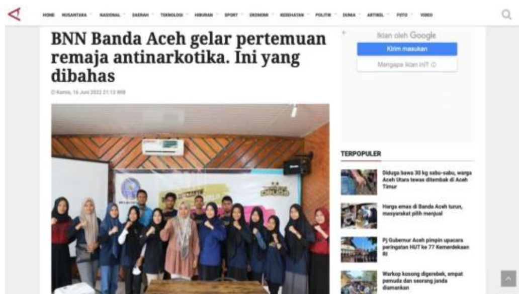
Gambar 3. Pemberitaan melalui portal berita online

Berdasarkan dari penjelasan para informan, pihak BNN Kota Banda Aceh pada dasarnya menggunakan dua macam media yaitu The Spoken Words dengan cara tatap muka langsung bersama para peserta dan The Printed Writing yaitu melalui media cetak seperti koran dan media sosial seperti Instagram. Pemerintah memiliki tugas untuk melayani masyarakat dengan semestinya agar masyarakat dapat sejahtera, begitu pula masyarakat harus bekerja sama dengan pemerintah agar terciptanya kemajuan dan kesejahteraan dalam banyak hal.